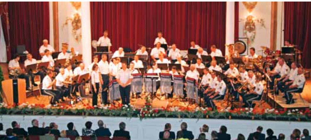
Konzert im Haydnsaal des Schlosses Esterházy in Eisenstadt – Juni 2011