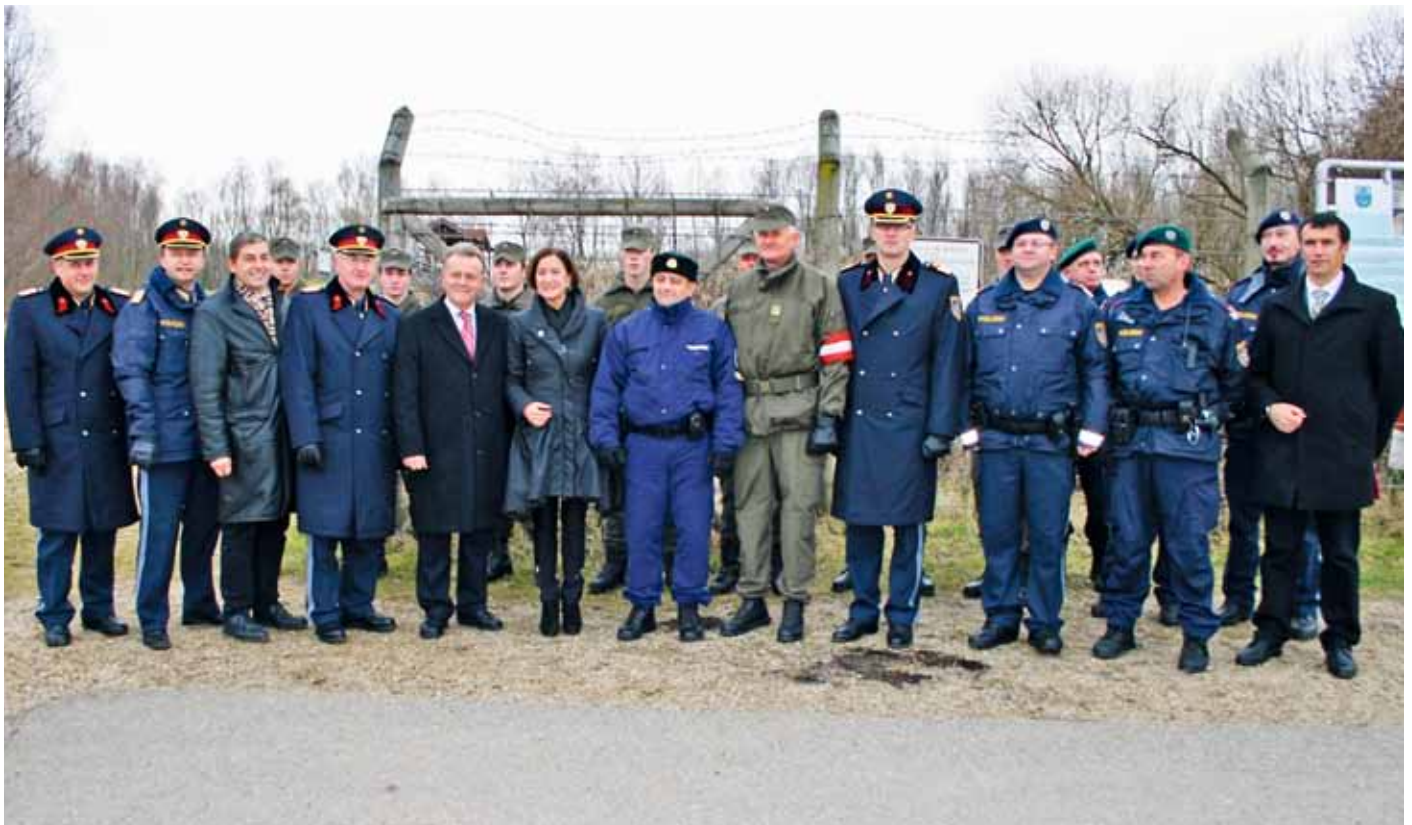
Stellvertretend für viele Kollegen und Kameraden nahmen sie Dank und Anerkennung von den verantwortlichen Politikern für mehr als 20-jährige erfolgreiche Arbeit entgegen

„Ich danke den Angehörigen des österreichischen Bundesheeres, dass