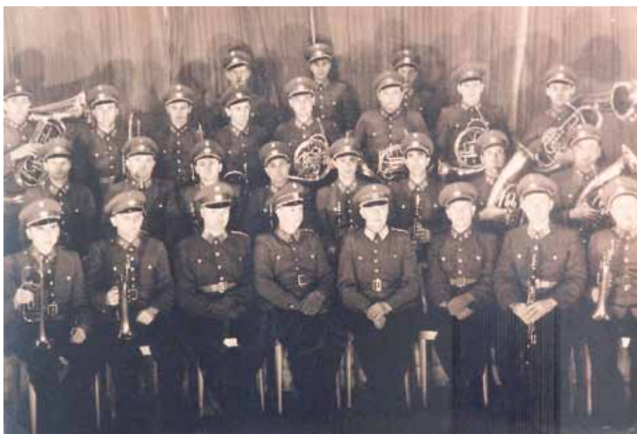
Die Musikkapelle zur Zeit der Gründung