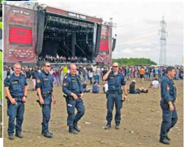
unten: Gut gelaunte Sicherheitskräfte freuen sich über eine an sich ruhige Veranstaltung

wird es gefährlich für Ordner und Polizisten. Sie drehen den Rücken schützend gegen die Menge, nehmen die Hände zum Oberkörper, werden aber dennoch gestoßen und angerempelt. Jeder hofft, nicht auf den Boden zu fallen. Nach wenigen Minuten ist alles vorbei. Glücklicherweise ist niemand gestürzt. Um einen guten Platz zu bekommen, wäre die rasende Menge einfach über die liegenden Sicherheitskräfte getrampelt und hätte auch eine Verletzung der Ordner und Polizisten in Kauf genommen. Alle eingesetzten Kräfte sind kreidebleich. Die „EE-ler“ atmen tief durch, formieren sich wieder und sehen nach Verletzten. Dann die Erleichterung - Funkmeldung an die Einsatzzentrale: „Niemand ist zu Schaden gekommen.“