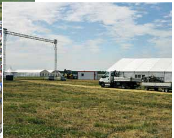
oben: Das Festgelände wird errichtet links: Viele Besucher verbringen die Nächte in ihren Zelten