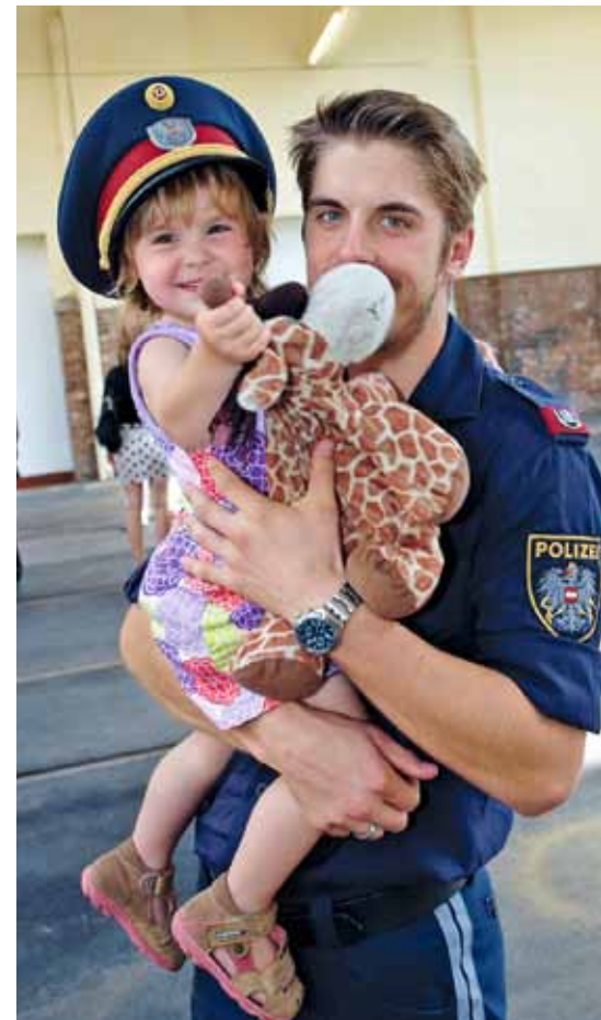
Väter können sich für die Betreuung ihres Kindes von der Arbeit freistellen lassen.

„Dieser gesamte Prozess ist für mich wie eine Lehre gewesen. Ich bin plötzlich auf mich ganz alleine gestellt gewesen.“ Für seine Partnerin war der Wiedereinstieg in das Berufsleben nach der Babypause sehr wichtig. „Sie geht wieder arbeiten und hat mit den Arbeitskolleginnen und Kollegen wieder Kontakt. Und sie wird durch den Beruf auch anderweitig gefordert“, sagt Huber.