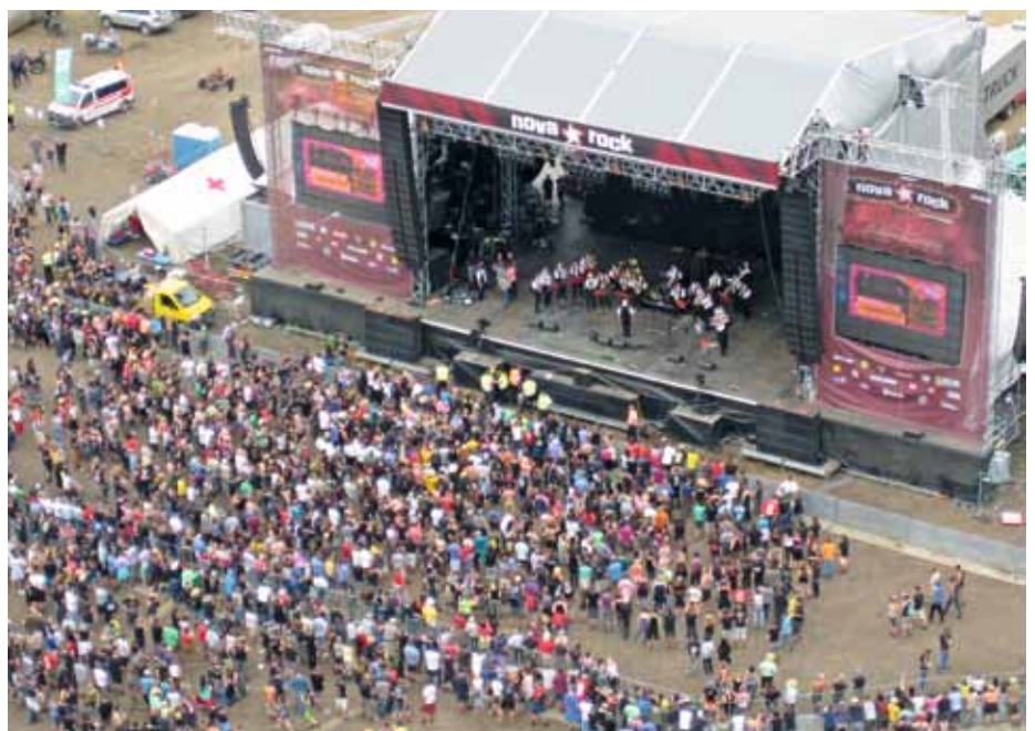
Stimmung wie sie besser nicht sein könnte