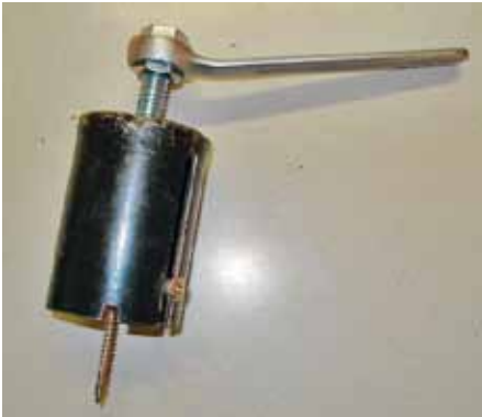
Dieses einfache Werkzeug dient zum Aufbrechen von Türschlössern bei Personenkraftwagen

wirtschaftlichen Betrieben im Raum Böhmeimkirchen, NÖ, gestohlen. Im Zuge weiterer Erhebungen konnten ihnen 78 Einbruchsdiebstähle mit einer Schadenssumme von 100.000.-€ nachgewiesen werden.