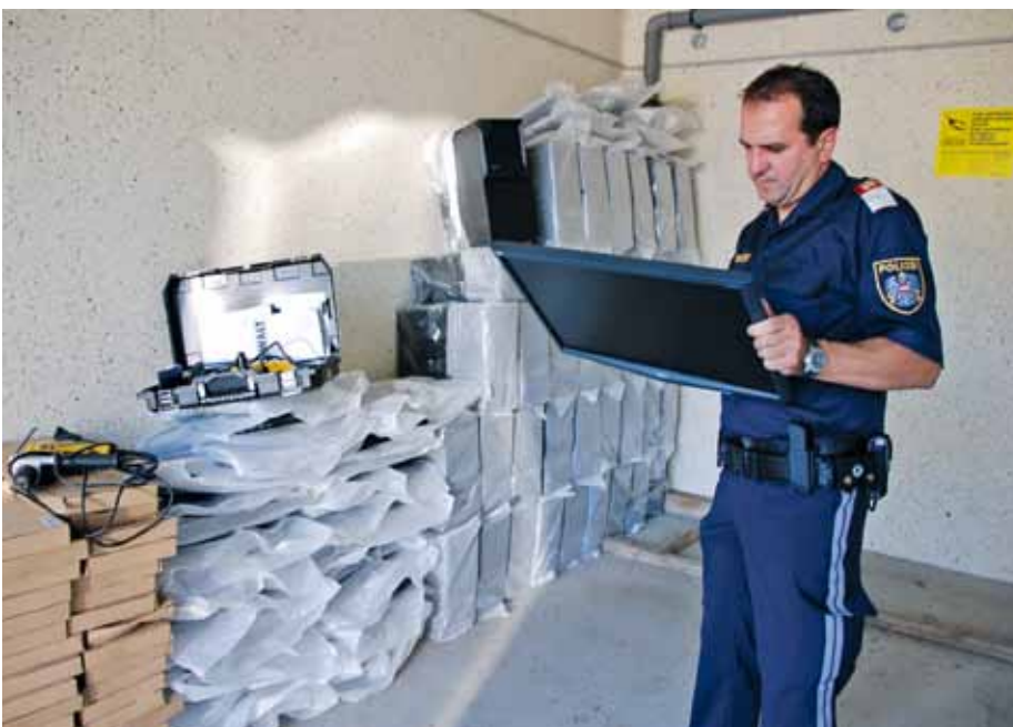
Ein Beamter sortiert beschlagnahmte LAP-TOPS, die vermutlich in Frankreich gestohlen worden waren

Über den Grenzübergang Nickelsdorf führte schon vor dem Fall des Eisernen Vorhanges die wichtigste Straßenverbindung von West nach Ost. Mit der Grenzöffnung stieg das Verkehrsaufkommen von ca. 15 Millionen Reisenden im Jahre 1989 auf etwa 40 Millionen im Jahre 2011. Zur Bewältigung dieses enormen Arbeitsaufkommens waren damals (1989) 120 Grenzgendarmen und 90 Zollbeamte eingesetzt – dieser Personalstand blieb mit geringfügigen Schwankungen bis zum Fall der Grenzbalken im Dezember 2007 annähernd gleich. Aufgrund dieser Zahlen ist leicht zu erklären, dass die Sicherheitskräfte mit Vorfällen konfrontiert waren, die sich eine Zivilperson kaum vorstellen kann. Auf der einen Seite stehen Beamte die ihre Pflicht tun und Straftäter aus dem „Verkehr“ ziehen müssen, auf der anderen Seite Reisende, die möglichst schnell über die Grenze kommen wollen. Sicherheit braucht eben Kontrollen, wodurch Kilometer lange Staubildungen, die heute glücklicherweise der Vergangenheit angehören, damals das Bild des meist frequentierten Grenzüberganges Europas prägten. Zuteilungen aus allen Bundesländern waren nötig. Viele KollegInnen werden sich – mehr oder weniger gerne – noch an ihren Dienst in Nickelsdorf erinnern.