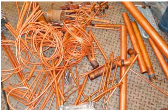
Loses Kupfer wie es von Installateuren verwendet wird

Es entwickelt sich eine filmreife Verfolgungsjagd, die auf ungarisches Staatsgebiet ausgedehnt wird. Unmittelbar nach der Grenze wendet der Täter das Fahrzeug und fährt über die