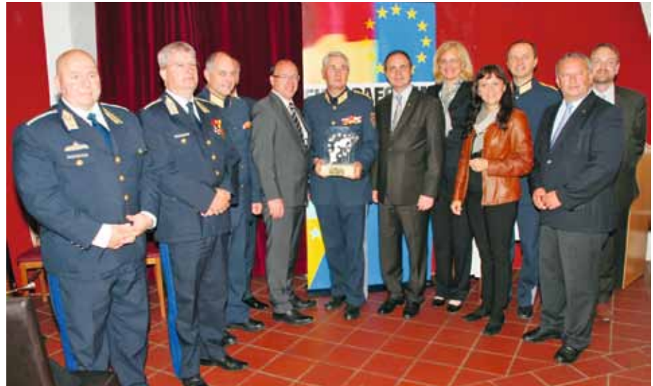
Ein vereintes Europa – auch Kollegen aus Ungarn waren in Uniform gekommen um dem Preisträger zu gratulieren

Mit Generalmajor Nikolaus Koch wurde in diesem Jahr erstmalig ein Exekutivbeamter für seine jahrzehntelange erfolgreiche Arbeit ausgezeich-