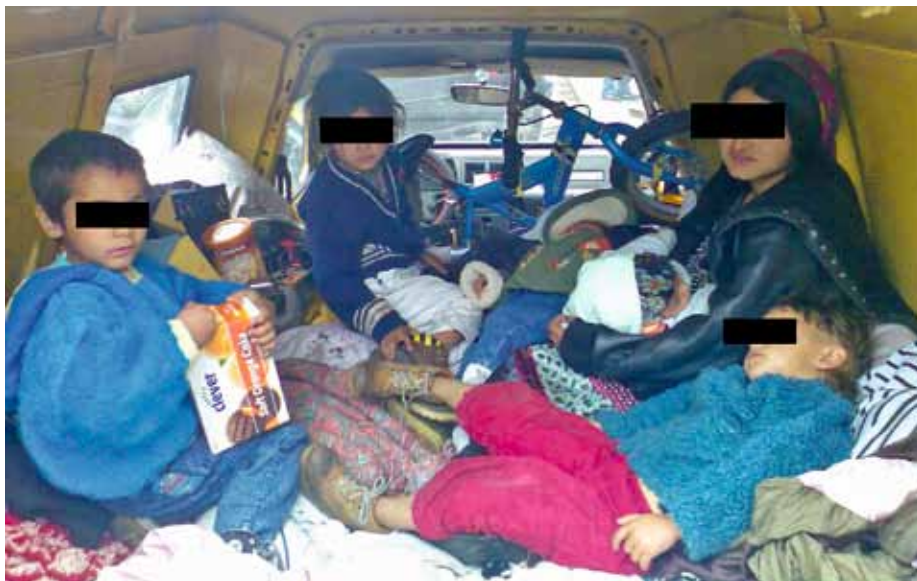
Illegale Grenzgänger, die von einem Schlepper in einen Kastenwagen gepfercht wurden

Während der Einvernahme des Täters kam ein Mann, bekleidet mit einer Überwurfjacke „Rendörség“ (zu Deutsch Polizei) zur Dienststelle und suchte seinen „Kollegen“. Er wies sich mit einer gefälschten ungarischen Polizeikarte und einem ebenfalls gefälschten ungarischen Polizeiausweis aus.