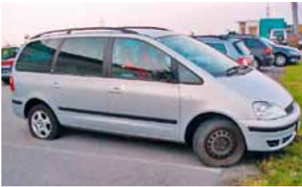
Dieses gestohlene Fahrzeug wurde sichergestellt, ehe der Besitzer den Diebstahl bemerkt hatte