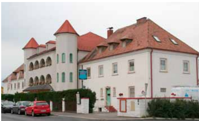
So sieht die einstige Schule – das jetzige Sporthotel aus - Foto Juni 2012