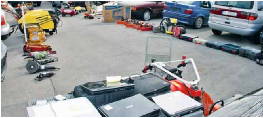
Diebstgut, das im Zuge der Kontrollen sichergestellt und zur Versteigerung freigegeben wurde

Wochen oder Monate in Anspruch. Vor allem dann, wenn die Diebstähle im Ausland begangen werden. In solchen Fällen muss über Interpol oder über die Polizeikooperationszentren ein Schriftverkehr eingeleitet werden, der manchmal mit bürokratischen Hürden verbunden ist. Erfolgt nach 12 Monaten keine Reaktion, so wird von den Polizisten an die Staatsanwaltschaft ein Bericht erstattet. Diese hat dann über den weiteren Verbleib der gestohlenen Gegenstände eine einstweilige Verfügung zu treffen und einen entsprechenden Antrag an das Gericht zu stellen. Erst danach wird das Diebstgut zur Versteigerung freigegeben. Ort und Zeit der Versteigerung – in diesem Falle die Polizeiinspektion AGM – wird auf der Internetseite der Ediktsskartei des Bundesministeriums für Justiz – einer breiten Öffentlichkeit zugänglich gemacht. Die Versteigerung wird dann durch einen Gerichtsvollzieher durchgeführt. Der Erlös fällt dem Staat zu. Bekundet jedoch der rechtmäßige Besitzer nach der Versteigerung Interesse an seinem Eigentum, so ist das Gericht verpflichtet, ihm den für diese Ware erzielten Preis zu übergeben.