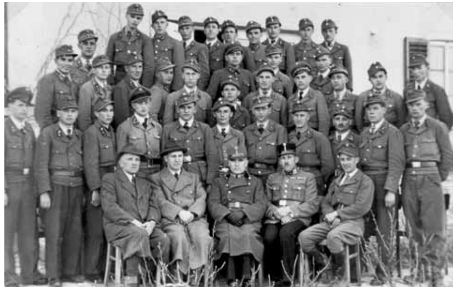
Der erste Grundkurs nach dem Krieg

Schon wenige Monate nach Kriegsende wurden diese nun „desolaten