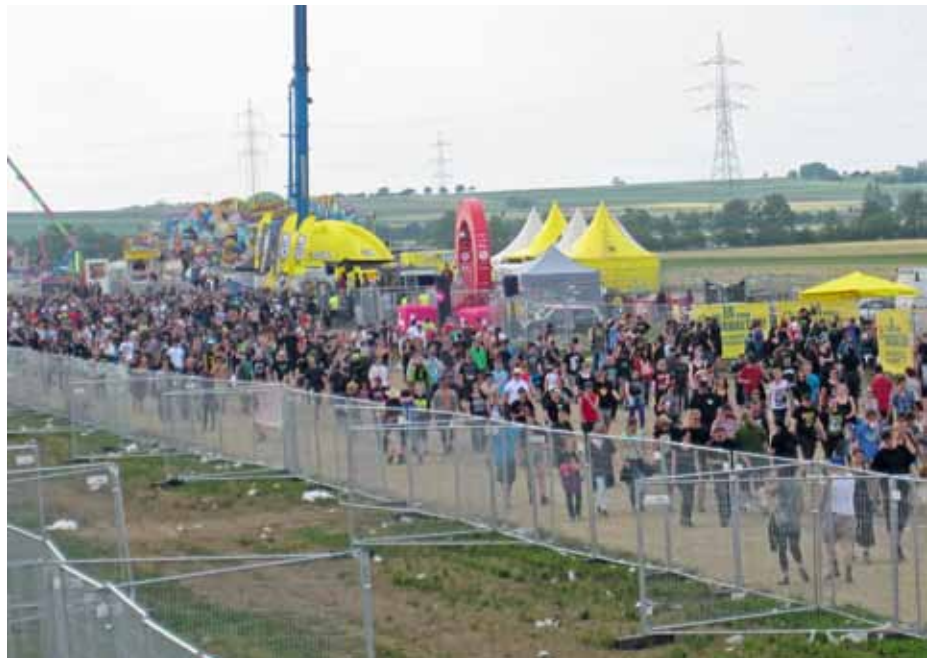
Gut gelaunte Besucher marschieren zu den Bühnen