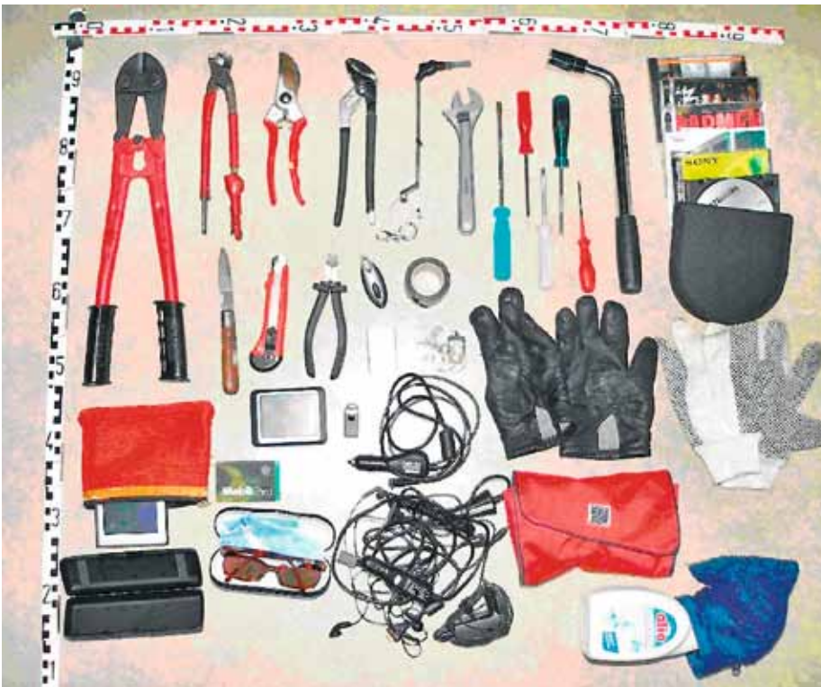
Im Kofferraum eines Fahrzeuges sichergestelltes Einbruchswerkzeug

Der Alltag am meist frequentierten Grenzübergang Europas