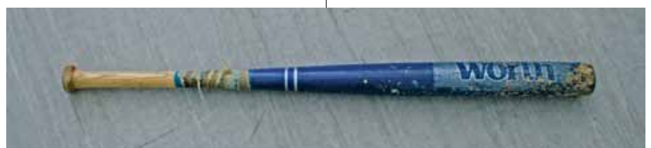
Mit diesem Baseballschläger wurde der Beamte attackiert

Es war am 20. Jänner 1999, als sich wieder einmal eine unendlich scheinende Blechkolonne gebildet hatte. Gegen 20:30 Uhr kam ein PKW der Marke Mercedes nach mehreren Stunden Wartezeit endlich zur Grenzabfertigung. Im Fahrzeug befand sich eine Familie, die von Nürnberg nach Novisad unterwegs war und nach Ungarn ausreisen wollte. Müde durch die lange Reise und