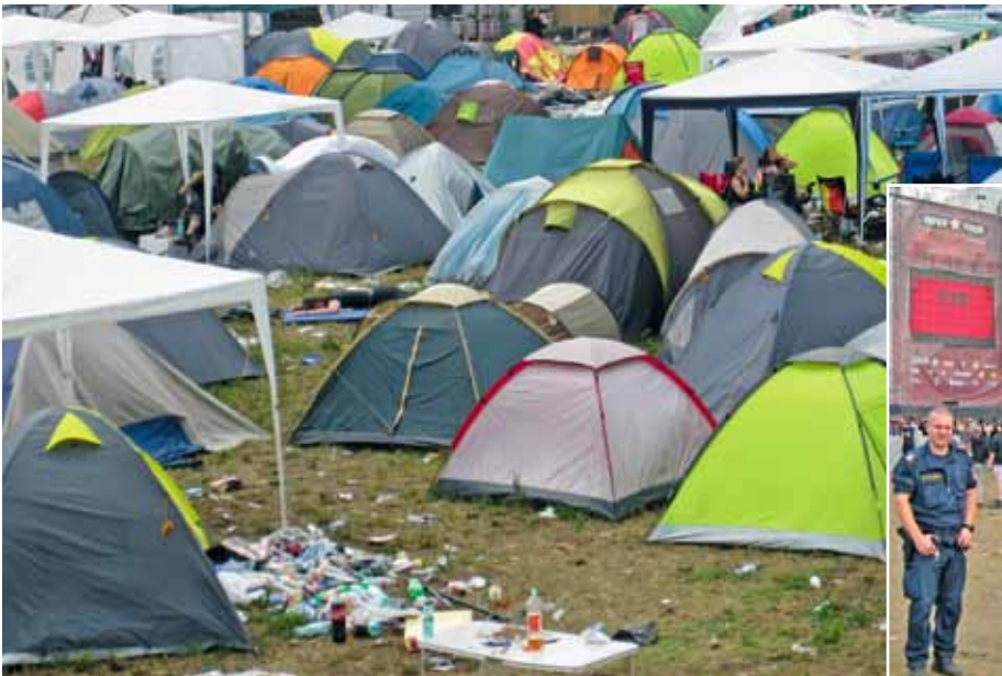
links: Das Fest ist vorbei.....