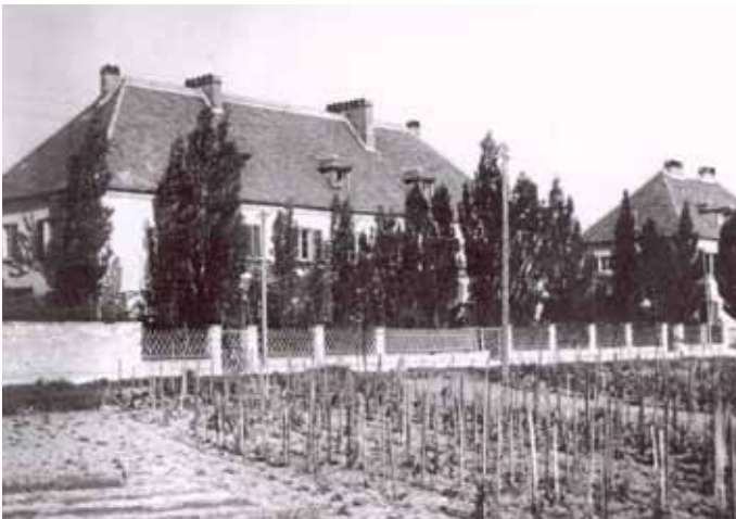
Die Gendarmerieschule wie wir sie alle kennen – in den 70er Jahren

Mitte der 80er Jahre kursierten Gerüchte, dass die Schule dem Sparstift zum Opfer fallen sollte. Sämtliche Interventionen von Stadtgemeinde und Landesgendarmeriekommando blieben ohne Erfolg. Im November 1987 kam dann das endgültige Aus. 41 Jahre wurden burgenländische Gendarmen ausgebildet, ehe ein letztes Mal zu einer Ausmusterungsfeier der Zapfenstreich erklang.