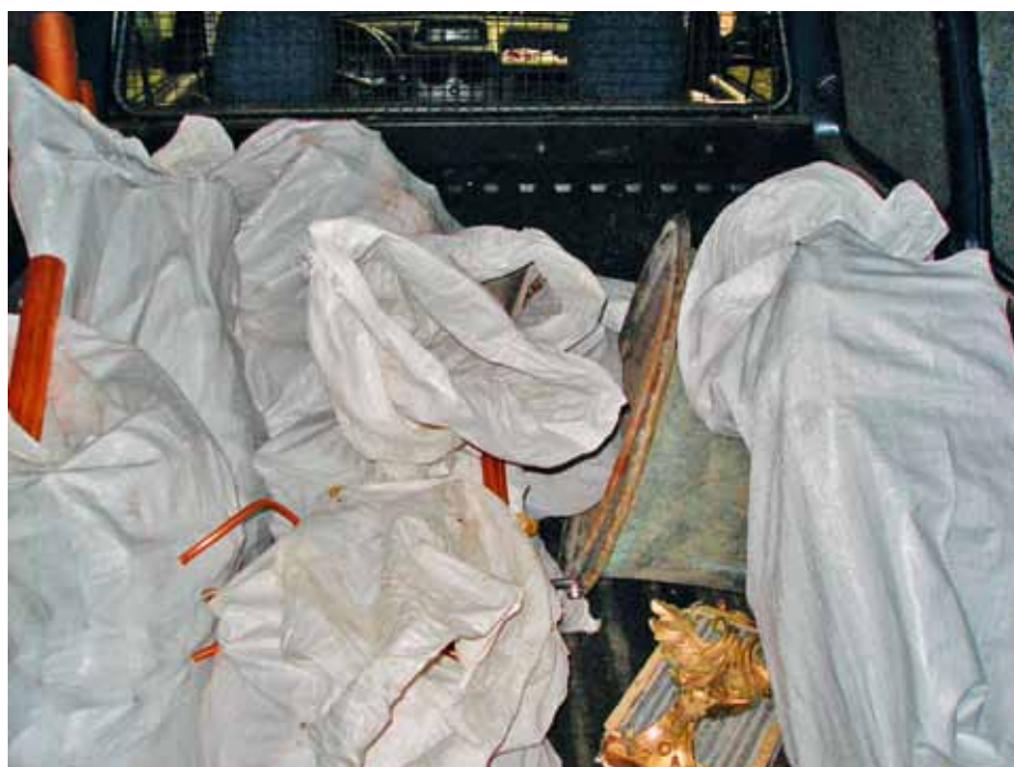
Kupferrohre, in Säcken verpackt

Der Autor eines Drehbuches hätte diese Geschichte nicht spannender zu Papier bringen können. Zwei Brüder und ein Vater mit seinem Sohn machen sich gegen Mitternacht mit zwei verschiedenen Fahrzeugen auf den Weg, um Einbrüche zu verüben. Sie