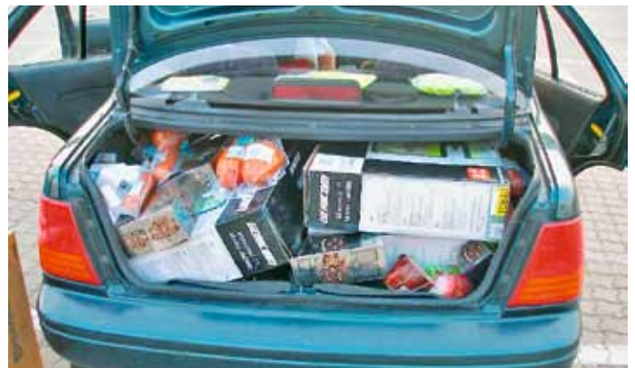
Diese Lebensmittel waren gestohlen und sollten außer Landes gebracht werden